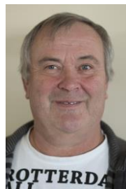
Peter van den