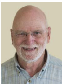
Rien Stoffels Tuin 199

De Bokashi emmers bevallen ook prima ik ben nu met de zesde emmer bezig. Je hebt geen last van nare geur en fruitvliegjes van het groene keukenafval. Een nadeel is dat de volle emmer vrij zwaar is. Als de volle emmer drie weken in rust is geweest (aan het fermenteren is) neem ik hem mee naar de tuin en leeg ik hem daar. Bij voorkeur werk ik de inhoud in de grond maar als de tuin vol staat is dat lastig dan werkt de inhoud prima als starter voor de compostering op de composthoop. De geleegde emmer spoel ik om en begin weer opnieuw met het vullen terwijl de andere emmer 3 weken met rust wordt gelaten. Het enige dat gedaan kan worden is van tijd tot tijd vloeibare mest aftappen. Deze mest verdun ik in een regenton waarmee ik de groenteplanten watergeef. Dit was de afgelopen maand hard nodig.