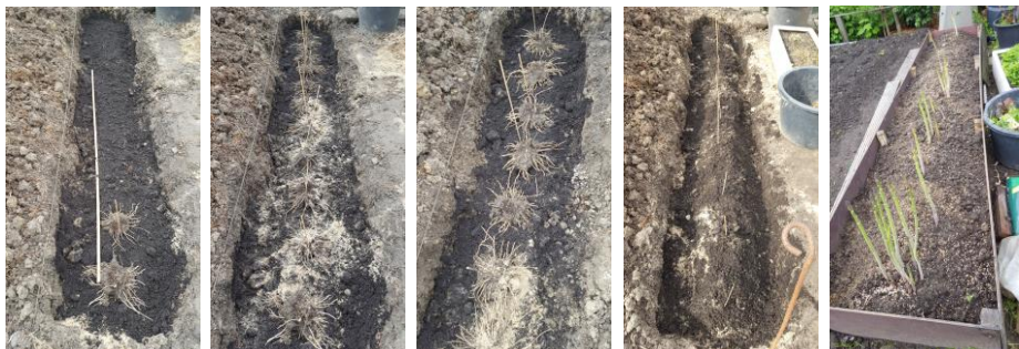
Verskillende stappen in de gegraven geulen.

Begin april 2018 heb ik de aspergewortels opgegraven die zich best mooi hadden ontwikkeld, om ze daarna op de definitieve plek te planten. Ik had er maar 11 nodig, de rest is naar een buurman gegaan. Het beste is om de wortels op een klein heuveltje te plaatsen en heb ik deze voor de zekerheid gemaakt van humusrijke grond, tuinaarde en weer veel zand.